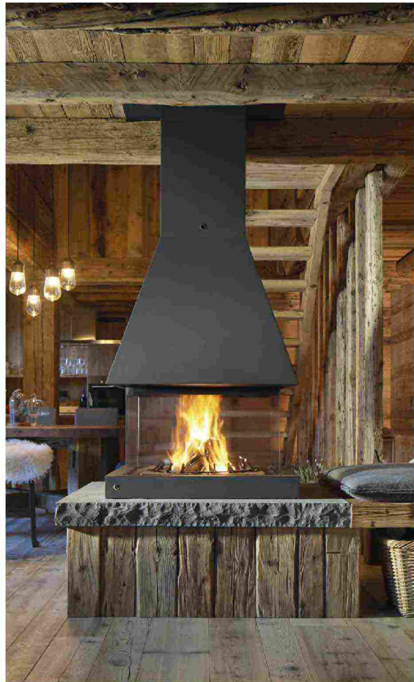
PIAZZETTA PANORAMIC M360Q

Ha una finitura spazzolata, dai morbidi riflessi miele, il pavimento in listoni di grandi dimensioni con struttura brevettata a tre strati, di cui quello a vista è in legno di rovere.